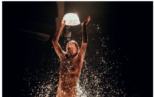
CICLO DE DANZA BUTOH Y LENGUAJES ESCÉNICOS AFINES. 25 de febrero.