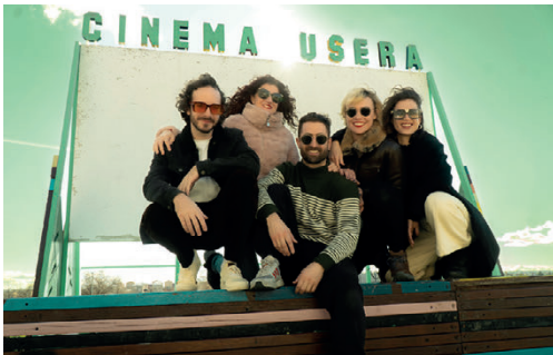
EL CUENTO DEL TOMATE FRITO. Cía. Doña Perfectita. 3, 4, 5, 10, 11 y 12 de febrero.

Ya tenemos dos de las cuatro columnas sobre las que se asienta este espacio de la calle Primitiva Gañán: colaboración y formación. El tercero sería la creación , que son las propuestas que la propia compañía exlímite desarrolla y que han quedado perfectamente plasmadas en reconocidos trabajos como Los Remedios o Cluster . Y el cuarto pilar sería la investigación , y es que exlímite pretende servir como espacio de encuentro y de realización de proyectos de investigación conectados con la formación y la potencial creación. La forma de investigar que proponen es a través de sus Laboratorios.