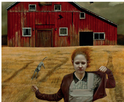
VERMÚ DRAMÁTICO. Teatro del Astillero. 5 de feb.

Iniciativa de Teatro del Astillero que se presenta con la sencilla intención de poner una primera voz a textos teatrales de muy reciente creación, una primera toma de contacto que nos va a permitir escuchar diferentes propuestas dramatúrgicas, de la mano de diversos equipos artísticos. Una suerte de aperitivo cultural, en el que compartir, analizar y, por qué no, discutir sobre el presente y el futuro de la escritura para la escena, en un ambiente de tertulia. Este encuentro está abierto a todos los profesionales de la escena, así como a cualquier persona interesada en la dramaturgia contemporánea.